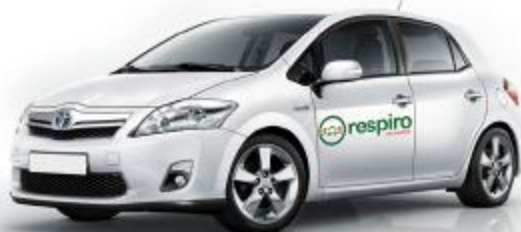
Toyota Auris Híbrido 1.8 L GPS

(*) Al enviar la documentación a respiro, adjuntar copia del carnet de la AEIT